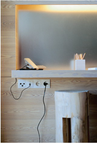
Mit dem Mehrfach-Rahmen von Berker lassen sich Multimediaanschlüsse kombinieren. Eine saubere Installation ist dabei gewährleistet.

mit denen sich Multimediaanschlüsse kombinieren lassen. Damit setzt man dem Kabelsalat von Mehrfachsteckern und Verlängerungskabeln ein Ende. Treffen dennoch vielen Leitungen zusammen, zum Beispiel von Fernseher, Bluray-Player und der Spielkonsole, lassen sich diese kinderleicht in einem „tehalit-Designkanal“ verstecken. Diese raffinierte Leitungsführung von Hager kann man mühelos nachträglich anbringen und ist daher auch für Mietwohnungen geeignet. Dank einer transparenten Plexiglasscheibe eröffnen sich zahlreiche Gestaltungsmöglichkeiten.