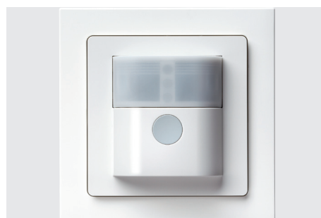
Mit Bewegungsmeldern steigern wir ganz unkompliziert die Sicherheit, den Komfort und die Energieeffizienz im eigenen Zuhause.