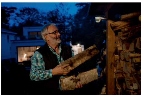
Außenbewegungsmelder sind bei jeder Witterung einsatzfähig und sorgen in den dunkelsten Ecken für Helligkeit.