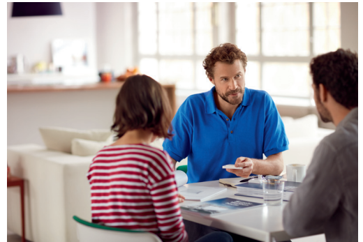
Der Elektrohandwerker übernimmt die anschließende Beratung und setzt den Traum vom intelligenten Zuhause professionell um.