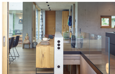
Die Schalter und Steckdosen aus dem Schalterprogramm R.1 von Berker fügen sich dezent in die Architektur ein und sorgen dennoch für wirkungsvolle Kontraste.

Herr Bechtle, Ihr Objekt besticht durch klare Linienführung und kontrastreiche Akzente – inwiefern kann sich da die Elektroinstallation eingliedern?