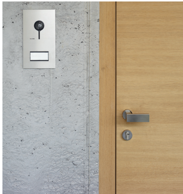
Die Außenstation der Türkommunikation ist optisch angenehm zurückhaltend und vereint dabei hochwertigste Technik.