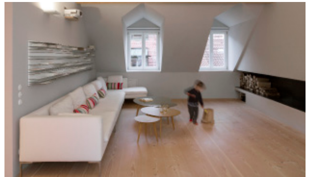
Das offen gestaltete Wohnzimmer profitiert unter anderem dank der Berker Schalter von einem tollen Kontrast zwischen modernen und klassischen Elementen.

Ein Highlight der Wohnung ist die 90 Quadratmeter große Dachterrasse. Aber auch im Inneren finden sich tolle Blickfänge. Dazu gehört zum Beispiel das Kinderzimmer des Sohnes, in dem Sofa und Bett in einer täuschend echten Almhütte zu finden sind. Oder auch die außergewöhnliche Sitznische direkt im Eingangsbereich neben den Garderobenschränken, die an einen Alkoven erinnert. Besonders stechen hier wie auch in anderen Bereichen der Wohnung die verwendeten