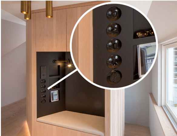
In der an einen Alkoven erinnernden Sitzecke sorgen die Schalter im Vintage-Look für eine nostalgische Note im Eingangsbereich.

Bodenbelag in Küche und Kinderbad beispielsweise Kalkstein verwendet, während für die restlichen Böden und viele Oberflächen im offenen Loft die Wahl auf fein gemaserte Douglasie fiel. Ebenfalls im Materialmix zu finden sind edles Messing für Küchenblock, Leuchten und Armaturen und lackierter Rohstahl für die Treppe und die Kaminbank. „Die Kombination aus robusten und feinen sowie bodenständigen und außergewöhnlichen Materialien ist das Geheimrezept der Wohnung“, verrät der Architekt.