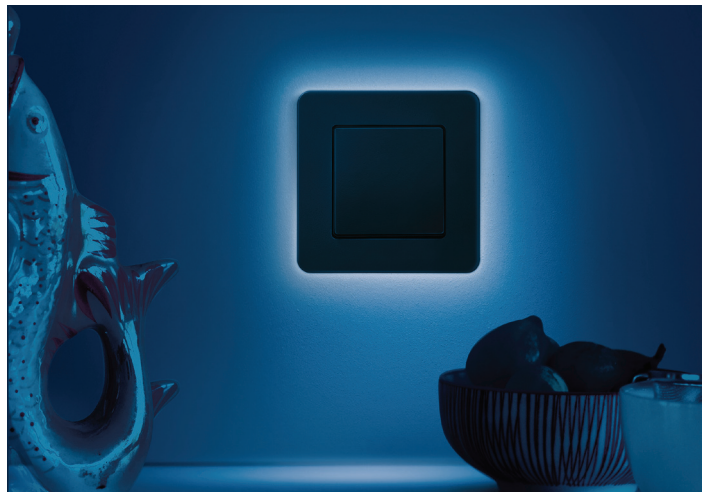
Der Berker Q.7 ist durch die Beleuchtung selbst im Dunkeln ein absoluter Hingucker.

Berker hat mit seinem Q.7 ein Designobjekt geschaffen, das förmlich auf der Wand zu schweben scheint und dafür mit bedeutenden Design-Awards ausgezeichnet wurde. Nun geht der Hersteller noch einen Schritt weiter und verwandelt den Lichtschalter gleichzeitig in eine Leuchte. Das besonders angenehme Licht setzt die hochwertigen Rahmen aus Kunststoff, Glas, Aluminium, Edelstahl, Schiefer oder Beton effektiv in Szene. So wird er auch im Dunkeln noch zum Eyecatcher. Ob die Lichtstärke dabei 100 Prozent oder leicht gedimmt 50 Prozent beträgt, ist dem eigenen Geschmack und dem gewünschten Nutzen überlassen. Ebenso die Entscheidung, ob man den Schalter als Dauerleuchte verwendet. Alternativ kann er auch nur durch Betätigung leuchten oder durch Kopplung an externe Schaltelemente wie ein Bewegungsmelder.