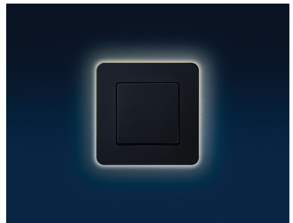
Das Rundum-Licht der Corona-Variante setzt die hochwertigen Rahmenmaterialien ganz besonders in Szene.

einschaltet, sobald die Helligkeit im Raum abnimmt. Damit wird er zur idealen Lichtquelle im Bereich von Treppenabsätzen und Eingängen. Besonders reizvoll ist das Downlight auch an Steckdosen: Durch die geringe Entfernung zum Fußboden dient es dann besonders gut als dezente Nachtbeleuchtung auf dem Weg zum Badezimmer. Die integrierten LEDs besitzen eine Lebensdauer von 30.000 Stunden, danach leuchten sie noch lange mit 50 Prozent der Ausgangshelligkeit weiter. So profitiert man über Jahre sowohl am Tag als auch in der Nacht von diesem Design-Highlight.