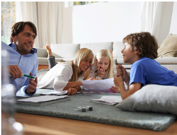
Dank Wärmepumpen wärmt sich der Wohnraum im Winter auf und im Sommer ab. Das sorgt stets für ein angenehmes Wohlfühlklima.