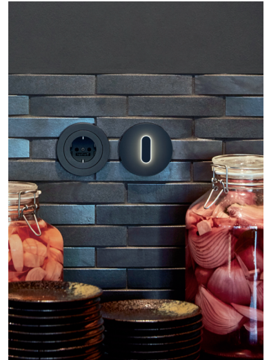
Die beleuchteten Drehschalter der Serie R.classic sind echte Hingucker in Küche und Co.

Des Weiteren hat Berker auch verschiedene, runde Drehschalter mit dem stilvollen Licht-Feature ausgestattet. Bei den Serien Glas, R.classic und 1930 lassen sich dank der Beleuchtung unterschiedlichste Effekte auf den individuellen Wohnstil abstimmen – egal, ob es sich in Sachen Material um edles Glas, puristischen Edelstahl oder glänzenden Kunststoff handelt. Was alle Schalterserien vereint: Die Beleuchtung kann für die neuen Drehschalter über ein steckbares LED-Modul jederzeit nachgerüstet werden. Einzigartig ist, dass so eine Orientierungs- und Statusbeleuchtung in einem Schalter genutzt werden können. Das dezente, kaltweiße Orientierungslicht macht den Schalter im Dunkeln sofort sichtbar. Die Statusbeleuchtung ist dagegen warmweiß und deutlich kräftiger. Sie zeigt an, ob etwa ein Leuchtmittel eingeschaltet ist. Damit kann beispielsweise ein besetztes WC mit außen liegendem Schalter gut kenntlich gemacht werden.