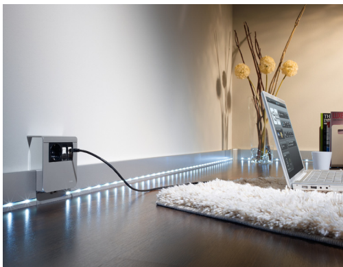
Beleuchtete Sockelleisten sorgen für komfortable Orientierung und setzen den Raum ganz besonders in Szene.

Ergänzend zu den Schaltern können bei Hager auch die Sockelleisten tehaliit.SL mit LED ausgestattet werden. Die LED Sockelleisten zeichnen sich durch einen homogenen